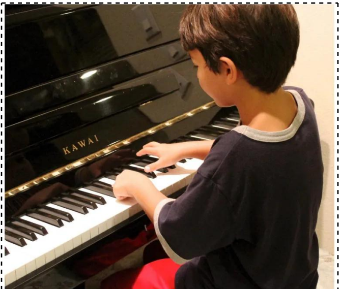
кыймыл-аракет пианинада ойнойт