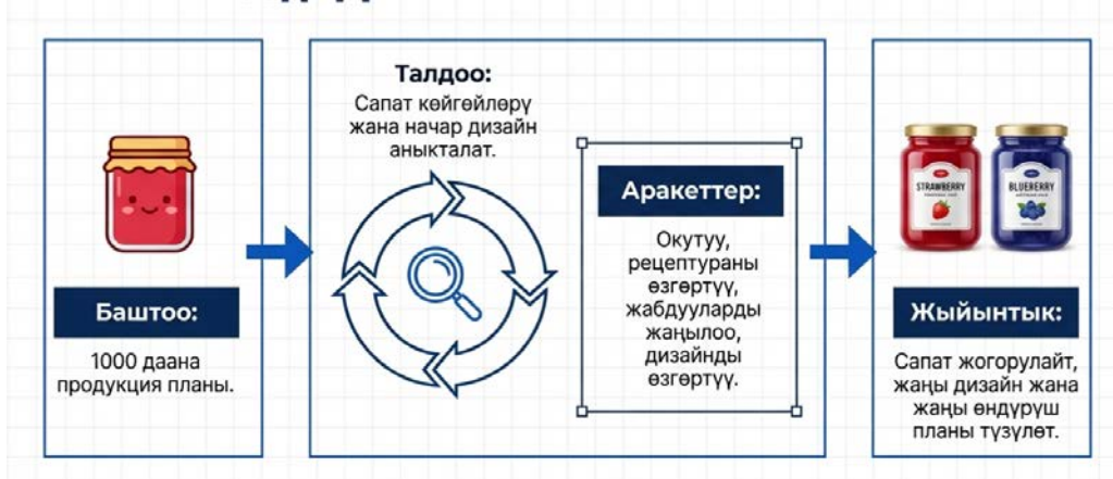
Сүрөт. Кыям өндүрүшүндө PDCAны колдонуу мисалы.