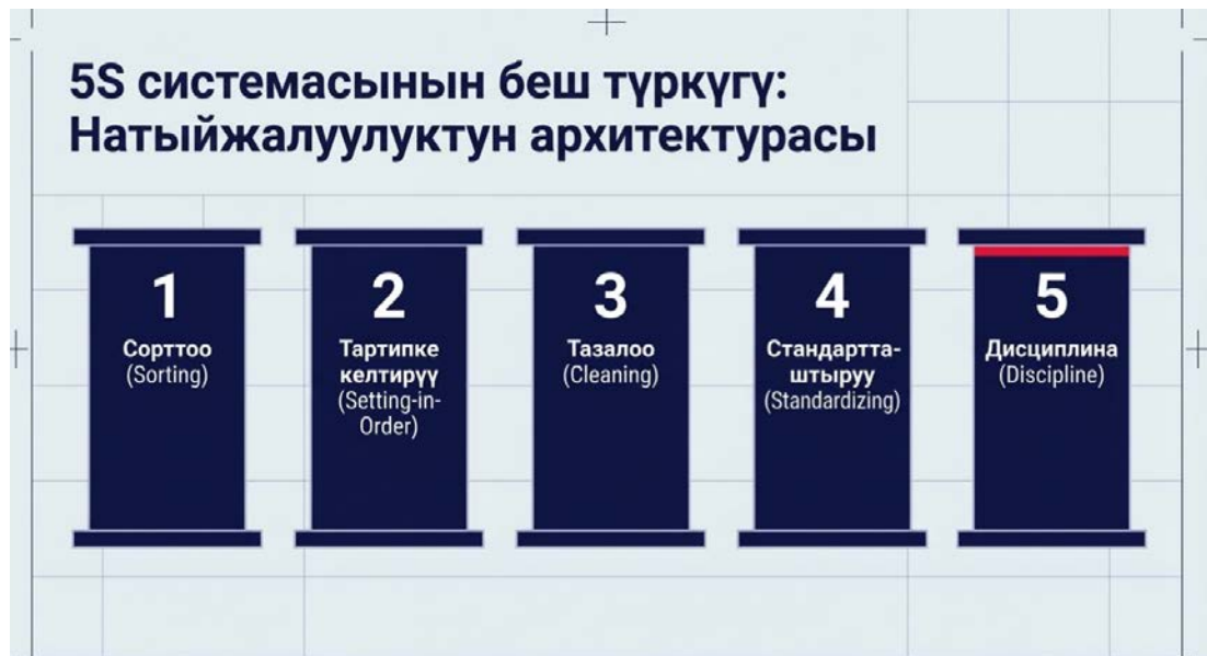
Сүрөт. Жумуш ордун уюштурууда колдонулган 5S системасы.

Негизги 5S кадамдары киргизилгенден кийин, бул система жөн гана тазалоо же тартипке келтирүү менен эле чектелбей турганын түшүнүү маанилүү. Иш жүзүндө 5S өндүрүштө тереңирээк маданиятты калыптандырат. Анда тартип күнүмдүк адатка айланат, ал эми эрежелерди сактоо күн сайын аткарылган иштин бир бөлүгү болуп калат.